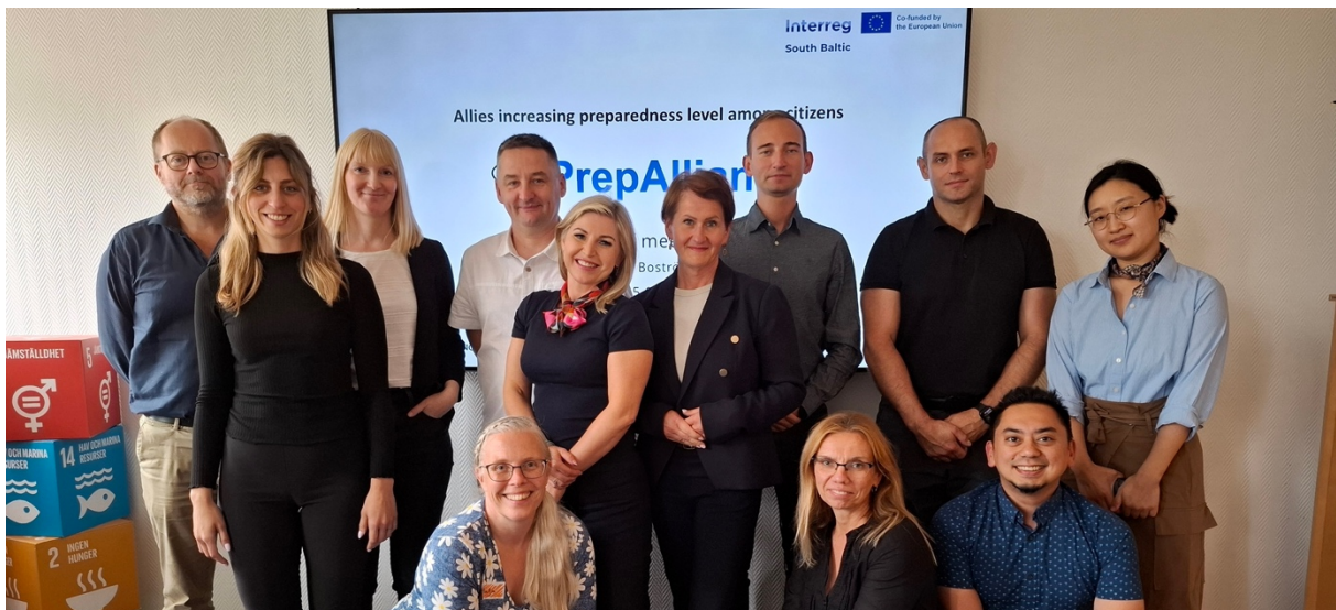
Projektpartners, associerade partners och representanter från finansiären träffades på vårt kontor under kickoffen i PrepAlliance.

Finansiärer: InterReg South Baltic Region