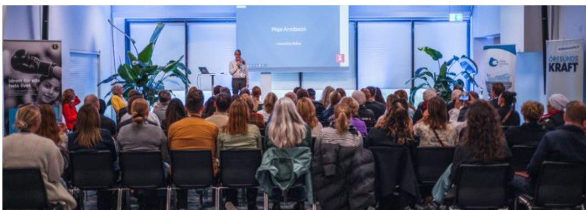
Slutkonferensen på Helsingborgs Arena den 15 oktober 2025.