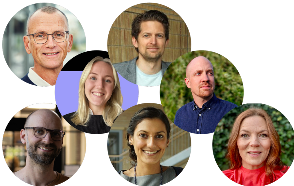
Kollage på alla talare på Cradlenets event 2025