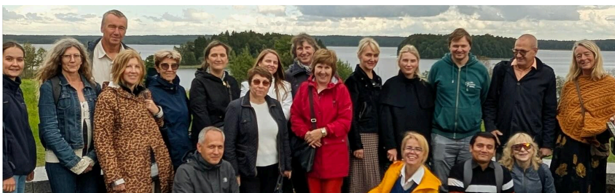
Econut projektmöte i Klaipeda i oktober.