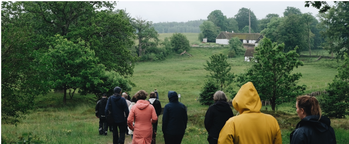
Exkursion i Storkriket.