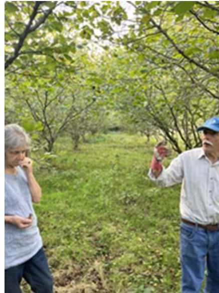
Friväxande öppen trädbuske