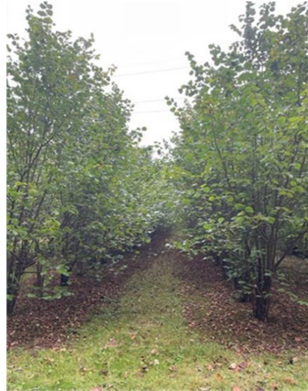
Trädbuske i radodling