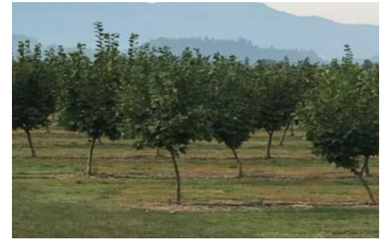
Kronträd ympad på turkisk hassel