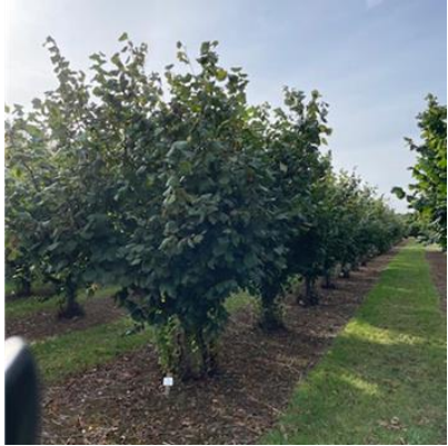
Kronträd Uppstammad på egen rot