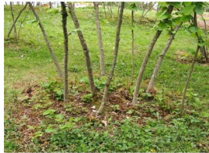
Figure 3. The appearance of ocak system in hazelnut