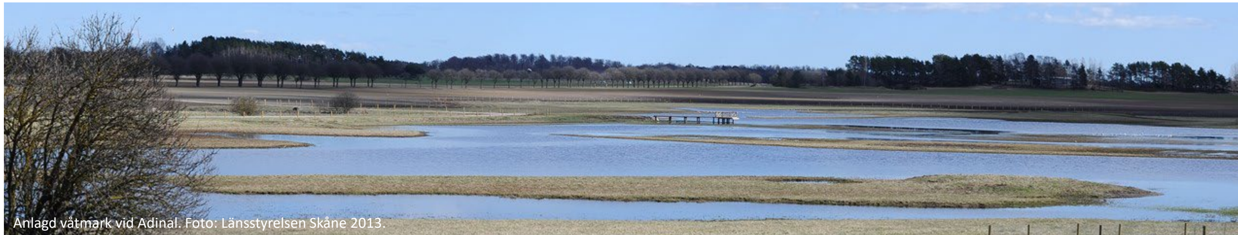
Anlagd våtmark vid Adinal.