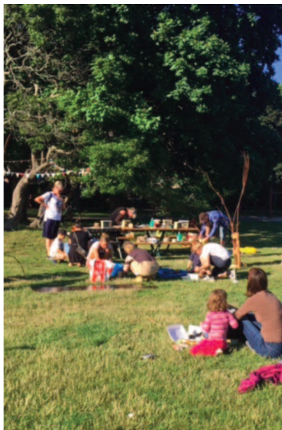
Bilden kommer från en av sommaraktiviteterna som hölls under sommaren i Enskifteshagen 2021, "Lär dig mer om insekter och träd".

Finansiärer: Europeiska regionala utvecklingsfonden (ERUF) via Tillväxtverket och projektpartners